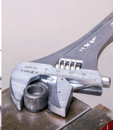
Llave ajustable profesional y multifunción