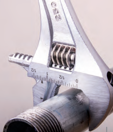
Boca reversible para trabajar con tubos