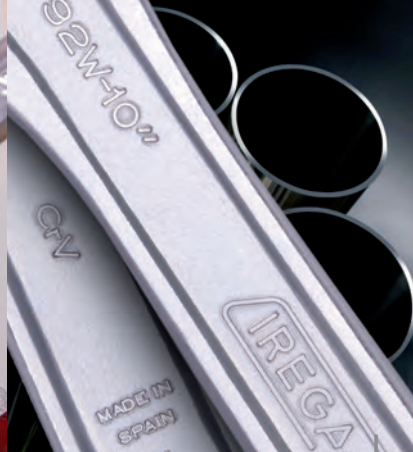
Fiable 100% (Garantía IREGA)

La Boca Reversible y su Apertura XTRA permiten trabajar con tuercas y tubos de mayores diámetros con la misma llave ajustable.