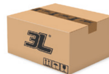
1000 unidades caja 1000 pieces box