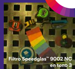
Filtro Speedglas™ 9002 NC en tono 3