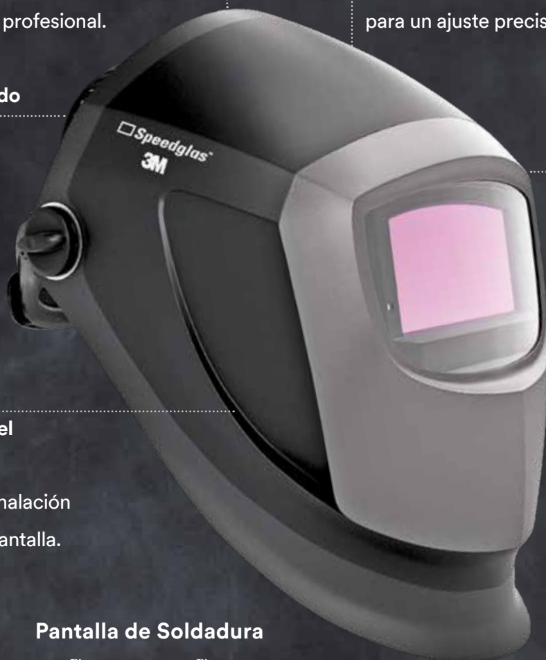
Pantalla de Soldadura 3M™ Speedglas™ 9002NC

Con salidas de exhalación integradas en la pantalla.