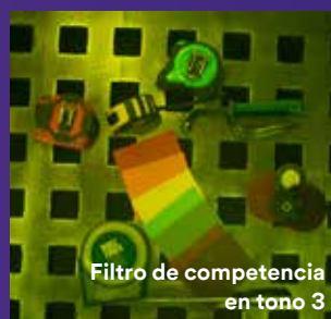
Filtro de competencia en tono 3